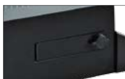
Débloccage par un levier accessible par une trappe avec serrure DIN