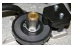
Embrayage mécanique bi-disque pour le réglage de la force